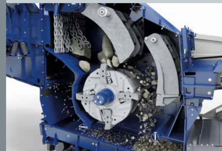
Unidade de britagem com entrada geometricamente otimizada