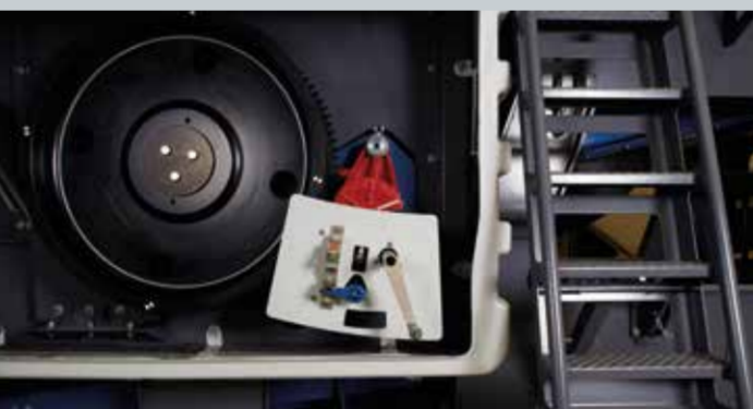
Sistema de segurança Lock & Turn

© KLEEMANN GmbH. Sujeito a alterações. Versão 2017-1