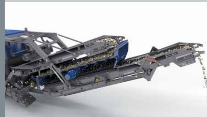
Peneira vibratória com superfície peneiramento extra grande