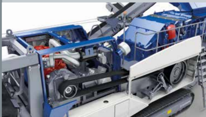
Acionamento direto do britador por meio de acoplamento de fluido