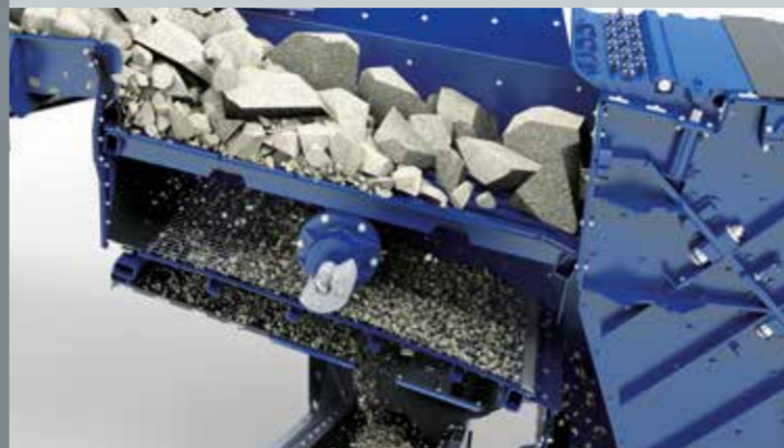
Pré-peneira de duplo deck independente