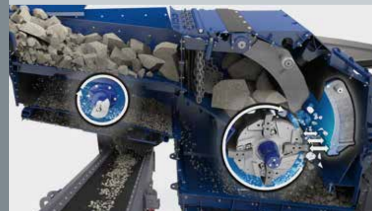
Sistema de alimentação contínua (CFS)